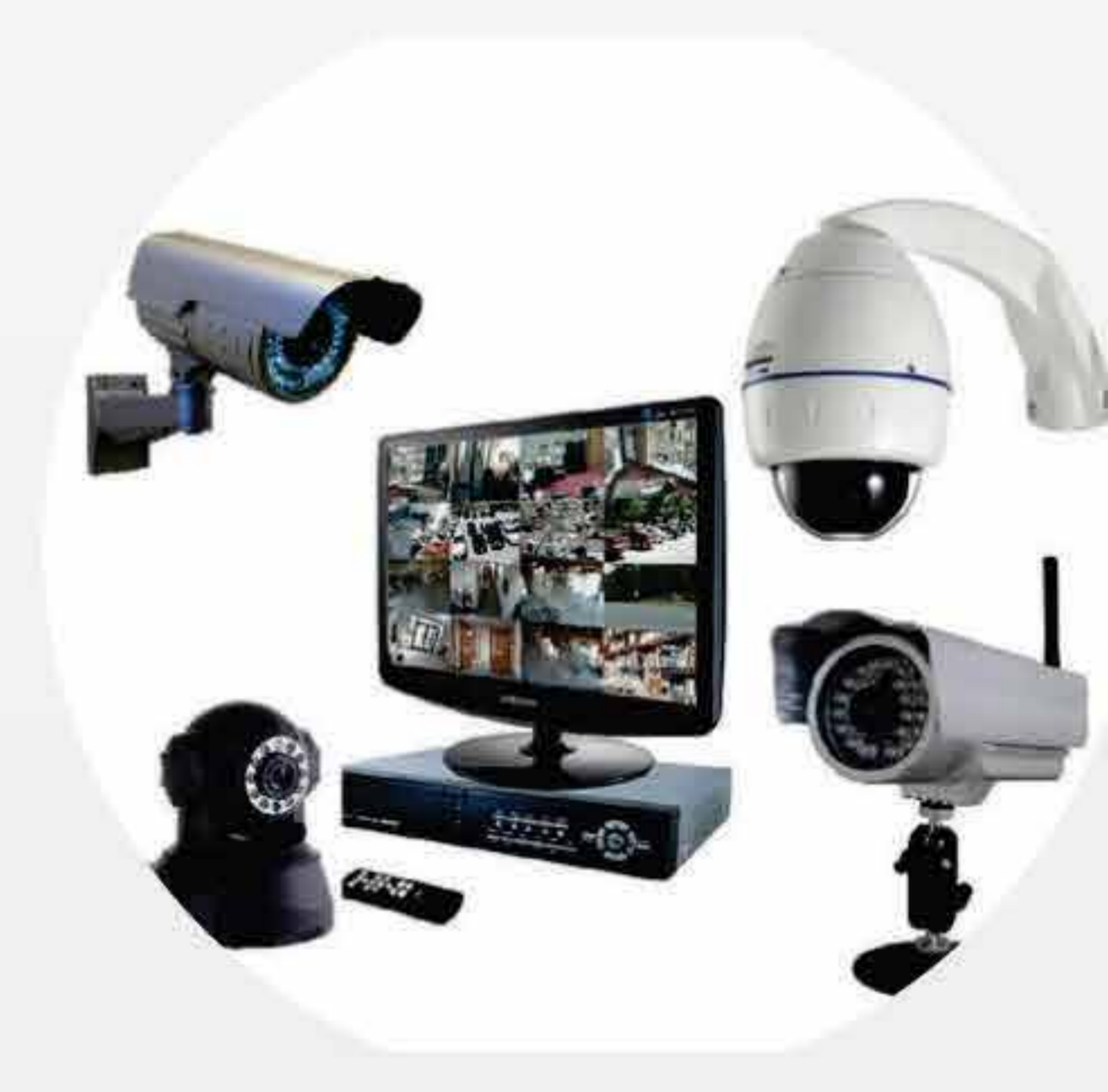
Segurança e Monitoramento