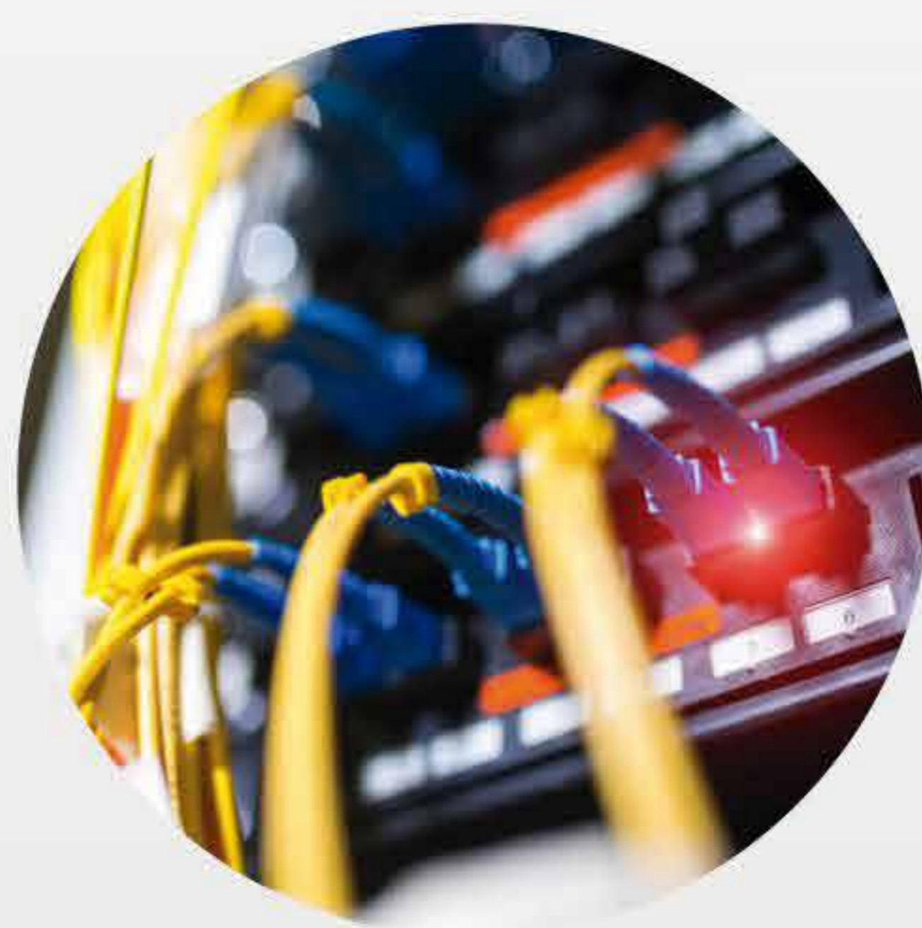
Equipamentos de REDE