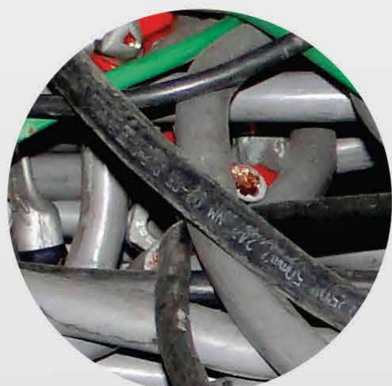
Cabos e fios