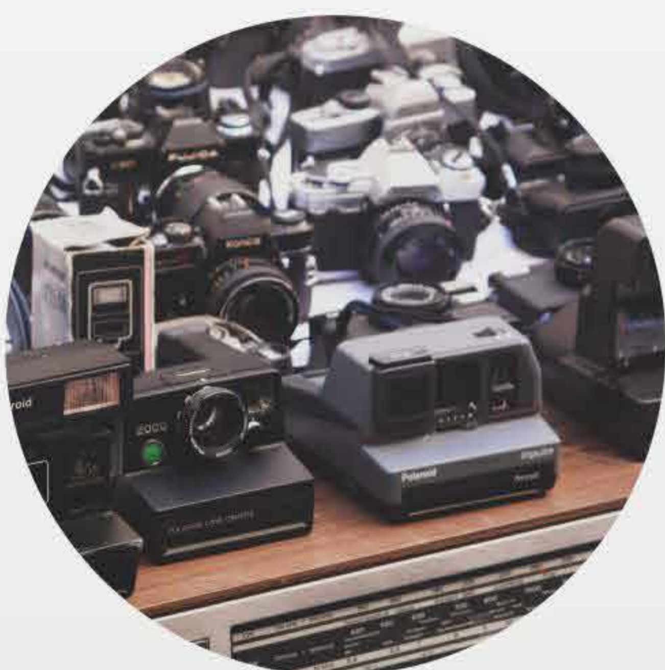
Imagem, Som e Vídeo