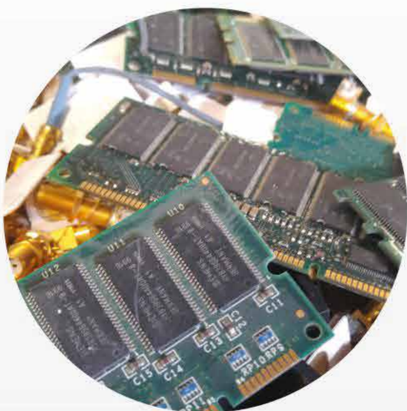
Placas eletrônicas Conectores